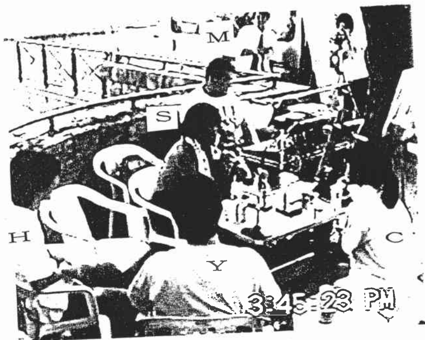
図7 番組「チャンチャンススペシャル」 カメラ I (3:45'23")

<断片5>は、この番組の仮のタイトルである「チャンチャンススペシャル」に代わる適当なタイトルをSとCが話し合っている場面である。Cの提案した「チャンチャンチャンどこいくの」に対して、Mが冗談半分で番組の内容がよく分からないと指摘したため、SとCが説明を加えている。