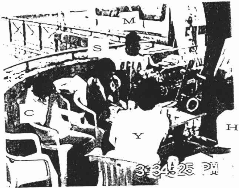
図4 SとYはマイクに正対 カメラI (3:34' 25")