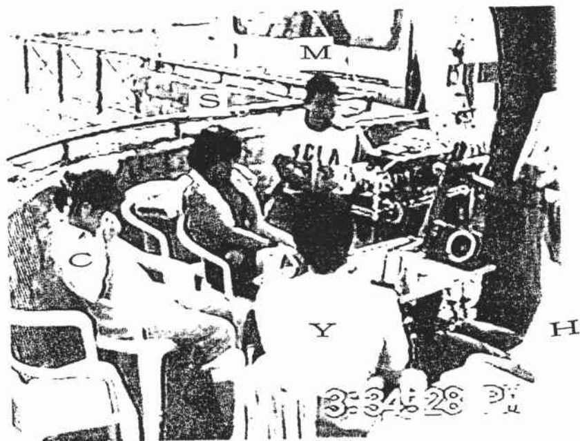
図5 SとYはマイクから離れる カメラI (3:34' 28")